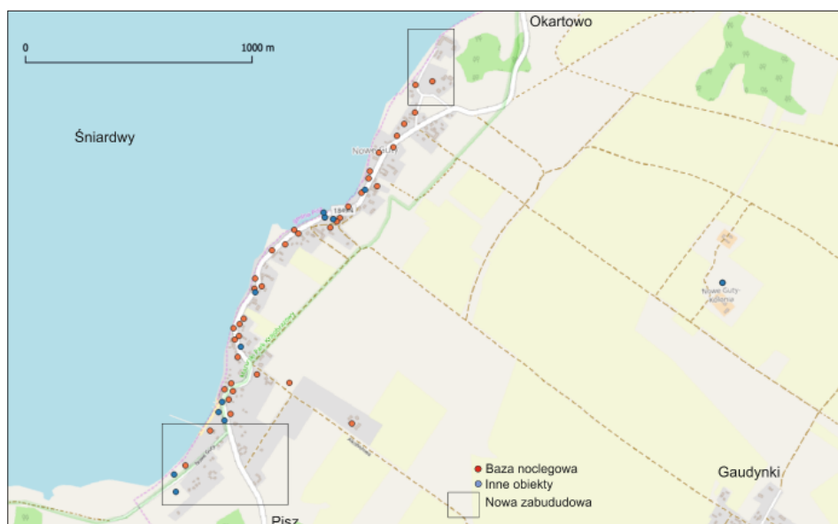
Ryc. 5. Infrastruktura turystyczna w Nowych Gutach