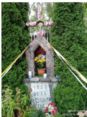
Fot. 24. Kapliczka (1952) „Boże błogosław Ojczyznę”

są: zaniedbany i zdewastowany cmentarz ewangelicki (fot. 12), rozbiórka linii kolejowej Pisz-Giżycko oraz wyburzenie budynku dworca kolejowego. W następnym etapie (socjalizacji i edukacji), poprzez naturalny kontakt i wrastanie w otoczenie o charakterystycznych typach krajobrazu, następowało przyjmowanie jako swoich elementów kultury symbolicznej, obcych dla rodzimej tradycji. W Nowych Gut powojenni przybysze przyjęli i zaakceptowali krajobraz kulturowy. Gospodarowali w zagrodach mazurskich bez ich przebudowy, dzięki czemu przetrwały one w niezmienionej formie (fot. 10). Kapliczka centrum wsi jest symbolem dwóch ostatnich etapów omawianego procesu, czyli dyfuzji kulturowej oraz całkowitego oswojenia krajobrazu kulturowego (fot. 24.). Wówczas nastąpiło przejęcie krajobrazu kulturowego bez interakcji z Mazurami i wzbogacenie go własnymi elementami. Dalsze zmiany następowały w fazie autentycznego oswojenia krajobrazu kulturowego. W ten etap wpisuje się rozwój infrastruktury turystycznej.