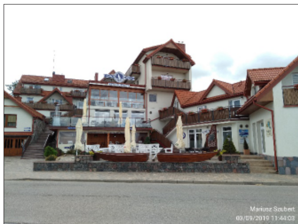
Fot. 22. Marina Śniardwy

W historyczny układ ruralistyczny wkomponowano również Ośrodek Wypoczynkowy „Panorama”. Obiekt składa się z nowego budynku (fot. 23) oraz dawnej zagrody (fot. 15), w której budynki gospodarcze i dom zaadaptowano dla celów noclegowych, z zachowaniem tradycyjnych cech architektonicznych.