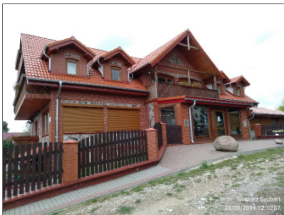
Fot. 23. „Panorama”