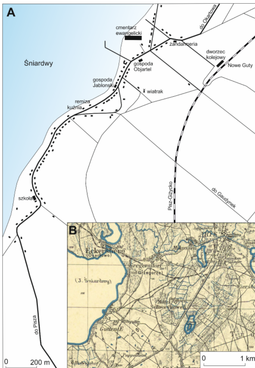
Ryc. 4. Nowe Guty przed 1945 r. A. Mapa wsi z 1945 r. B. Nowe Guty na mapie topograficznej 1:100 000.