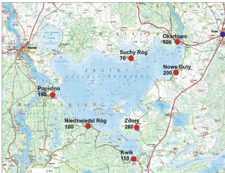
Ryc. 1. Wsie turystyczne nad jeziorem Śniardwy

Nowe Guty należą do gminy Orzysz, położonej na Pojezierzu Mazurskim, w Krajinie Wielkich Jezior Mazurskich i na Równinie Mazurskiej. Wieś leży nad jeziorem Śniardwy, przy wschodniej granicy Mazurskiego Parku Krajobrazowego (ryc. 1). Jednym z czynników decydujących o atrakcyjności turystycznej Nowych Gut są walory przyrodnicze. Do najważniejszych należy zaliczyć: krajobraz polodowcowy z dużym udziałem jezior oraz bogactwo flory i fauny w lasach i na terenach bagiennych (m.in. awifauna: bąk, hełmiatka, rybołów, różeniec, puchacz, orzechówka i bocian czarny). Ostoją unikatowej flory i fauny są liczne rezerваты przyrody. Jeden z nich – „Jezioro Łuknajno” (niedaleko Mikołajek) znajduje się na Światowej Liście Rezerwatów Biosfery UNESCO. Wśród 12 jezior na terenie gminy Orzysz dominują Śniardwy – jezioro wyróżniające się urozmaiconą linią brzegową, wysepkami i przybrzeżnymi głazowi-skami. Niedaleko jest też Puszcza Piska.